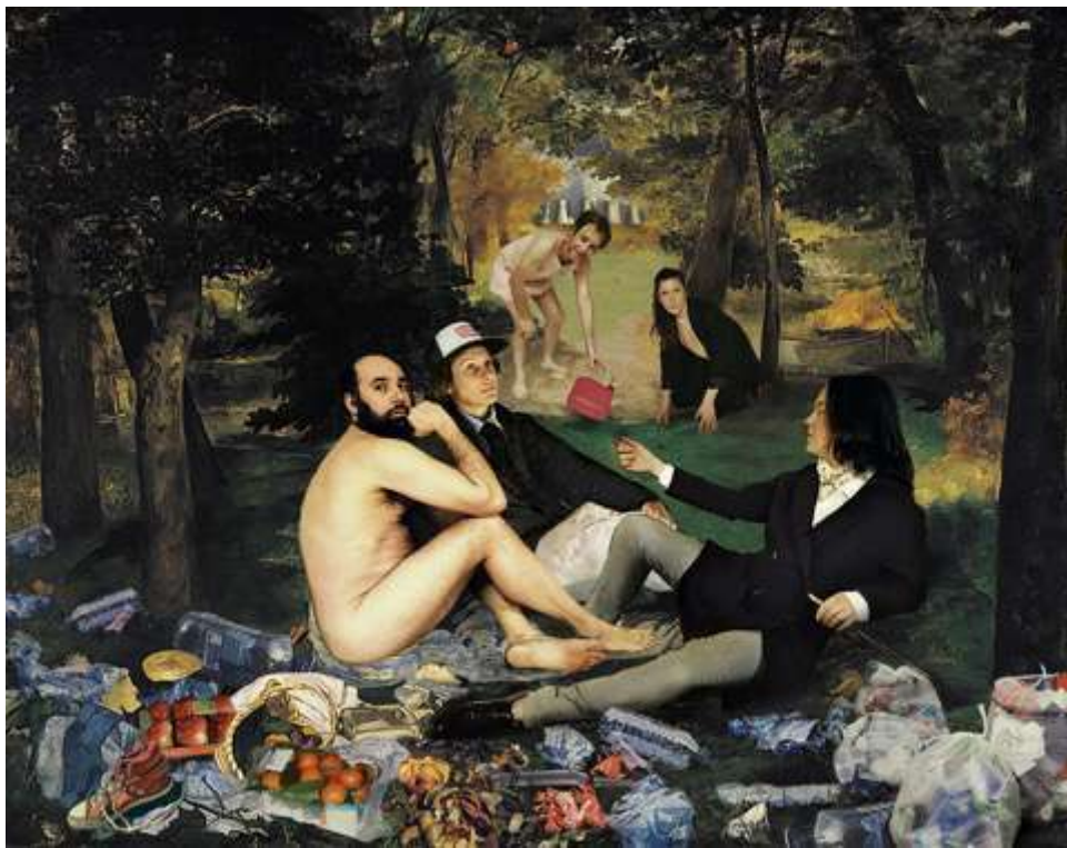
© Olivier Marty / L'Avantage du Doute