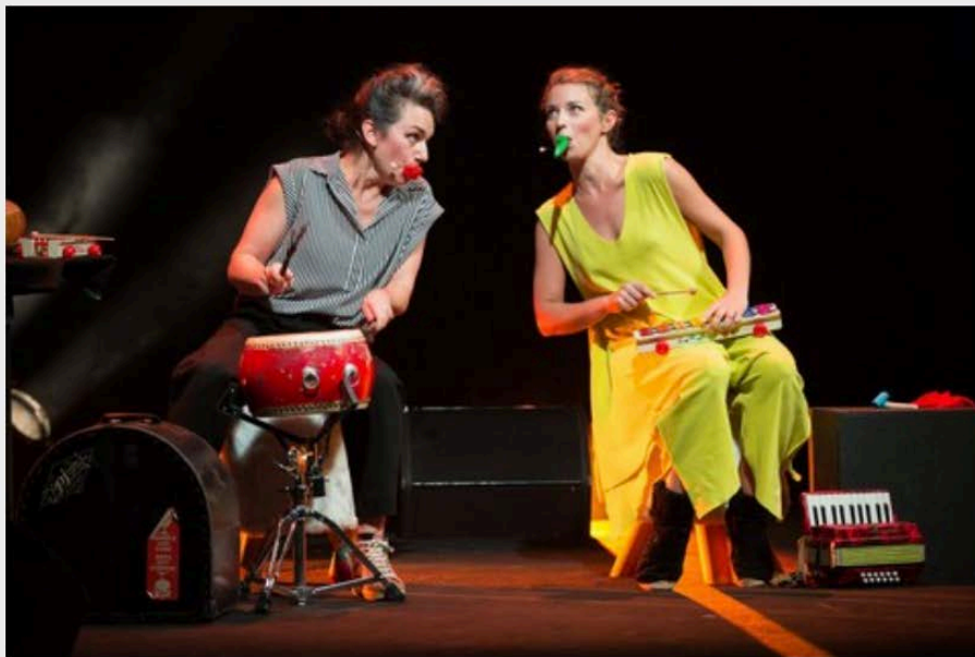
Söta Sälta

Tous les 15 jours, le Mercredi, la chronique JEUNE PUBLIC animée par Nicolas Céléguène