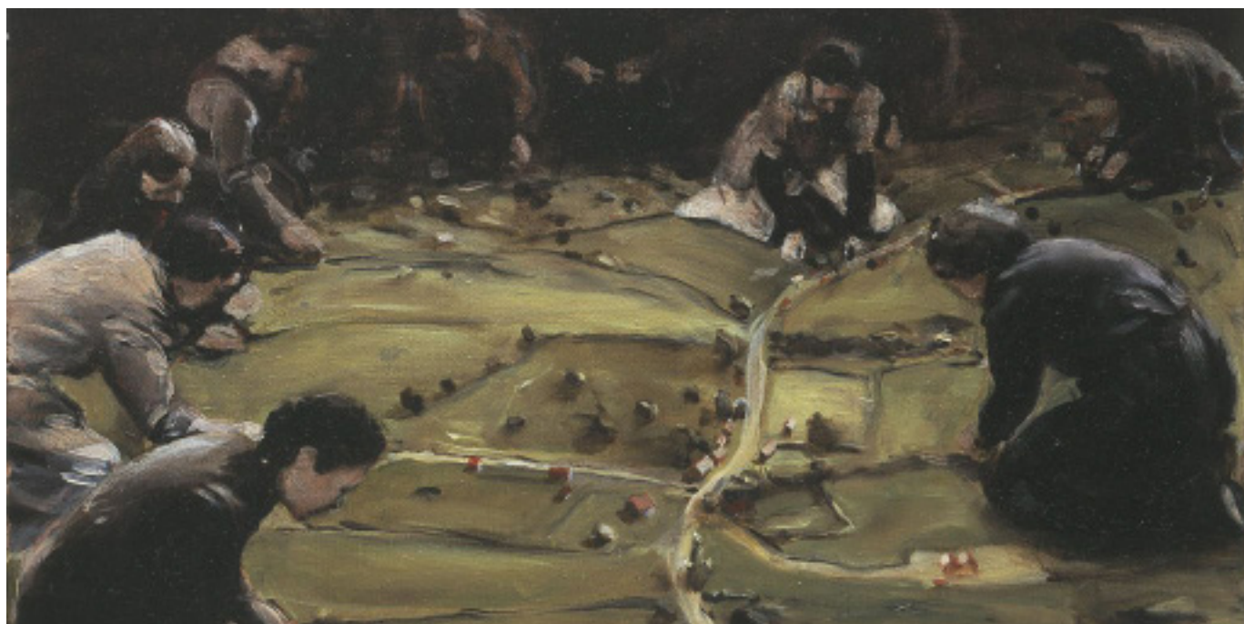
oeuvre picturale de Michaël Borremans