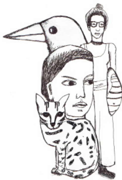
Dessins préparatoires Emilie Flacher - 2021