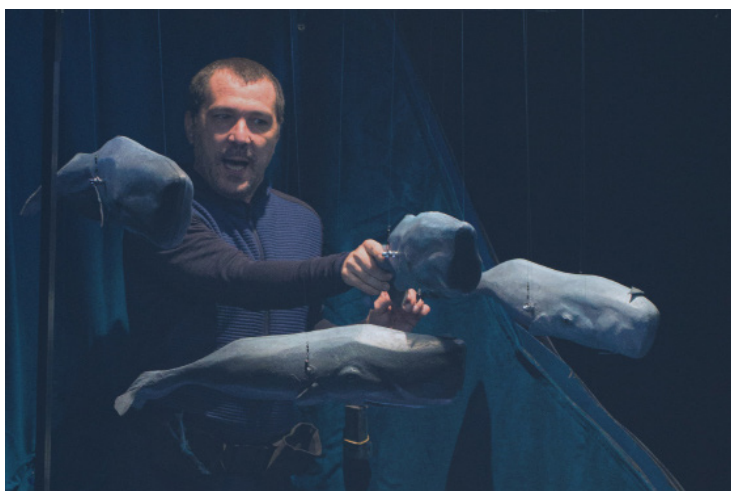
Spectacles Les Acrobates & BUFFLES