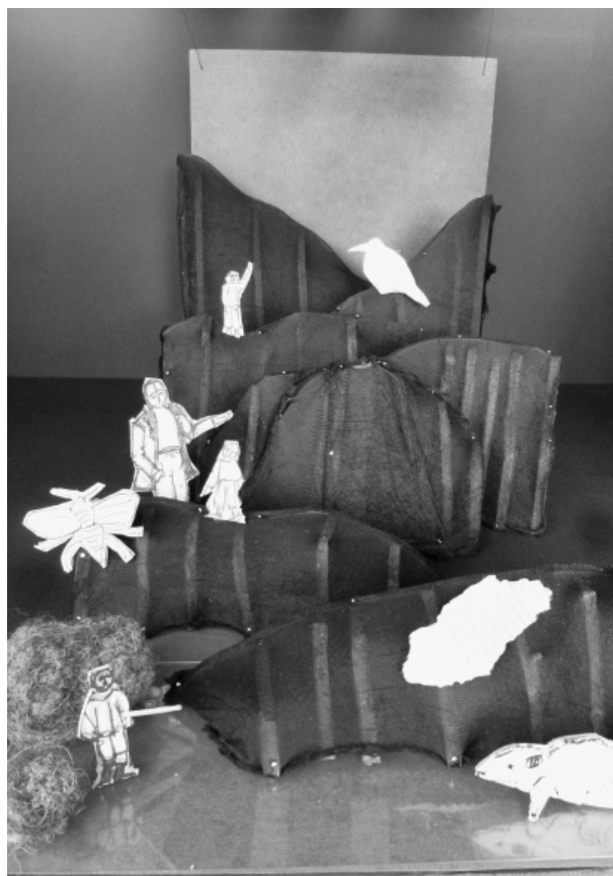
Maquette scénographie NOTRE VALLEE par Stéphanie Mathieu

La scénographie propose un rapport organique au territoire, où les corps semblent faire partie du territoire qu'ils habitent, constitué par eux en quelque sorte, comme une façon de rendre visible l'enchevêtrement des vivants entre eux, et comme une façon de remettre l'homme à sa place d'animal humain.