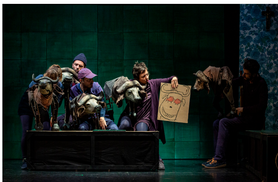
Marionnette végétale - la digitale pour la fable «L'agneau a menti» d'Anaïs Vaugelade Spectacle BUFFLES - photo Michel Cavalca