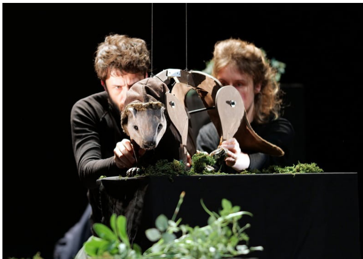
Prototype castor pour NOTRE VALLEE