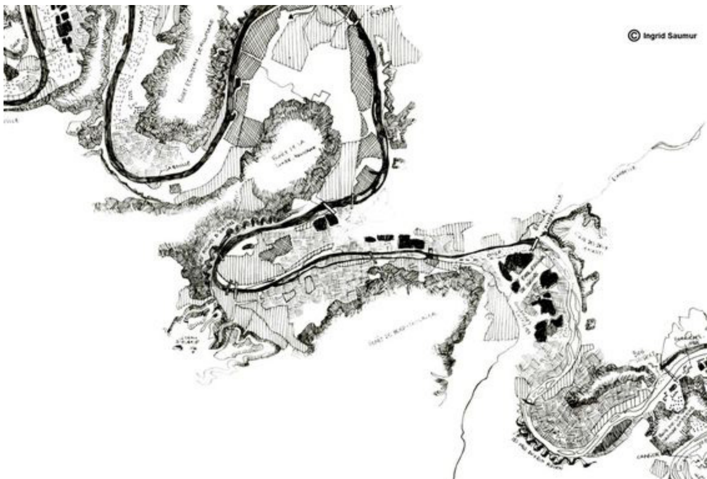
Une vallée - cartographie sensible par la paysagiste Ingrid Saumur