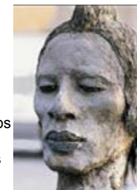
Ousmane Sow - visage