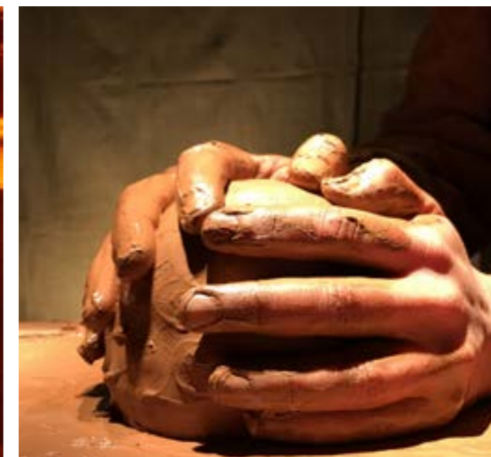
détails de la transformation de la matière argile durant le spectacle- janvier 2021 TJP Strasbourg