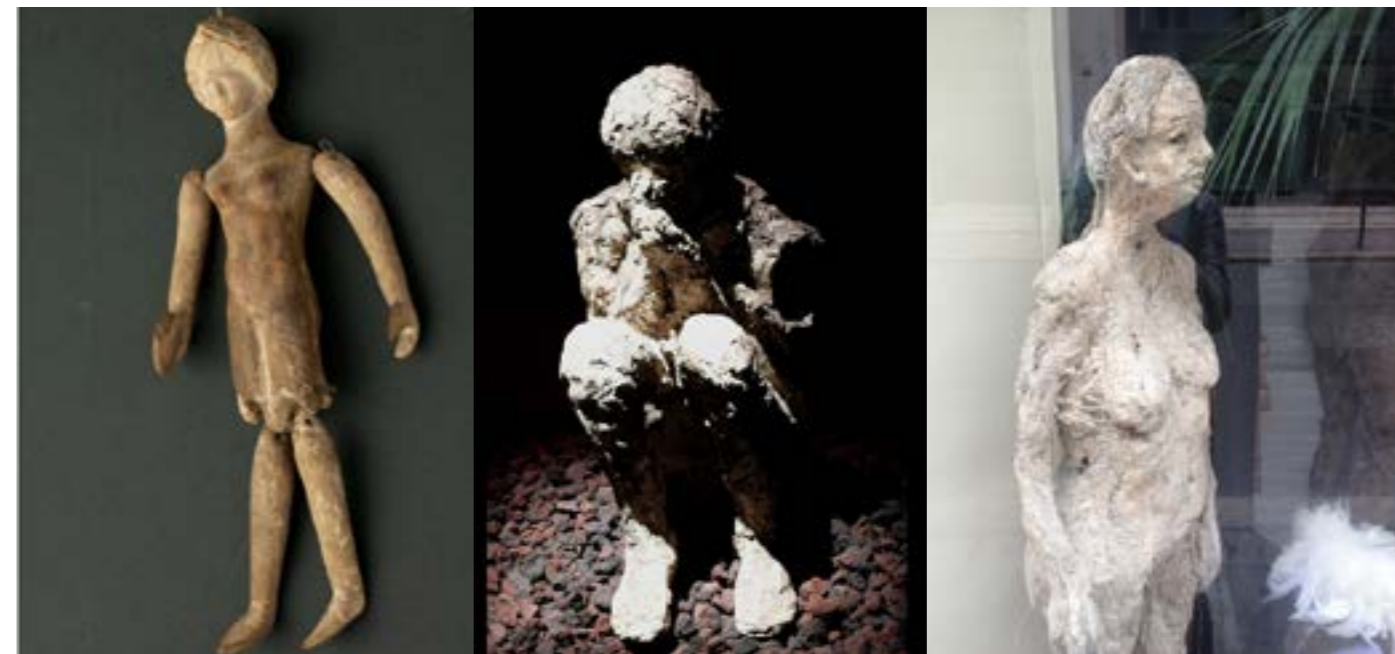
marionnette de type tanagra, Sicile Antiquité (Vème ou VIème siècle) NB: plus ancienne marionnette trouvée et conservée à ce jour collection Jacques Chesnais - Portail des Arts de la Marionnette