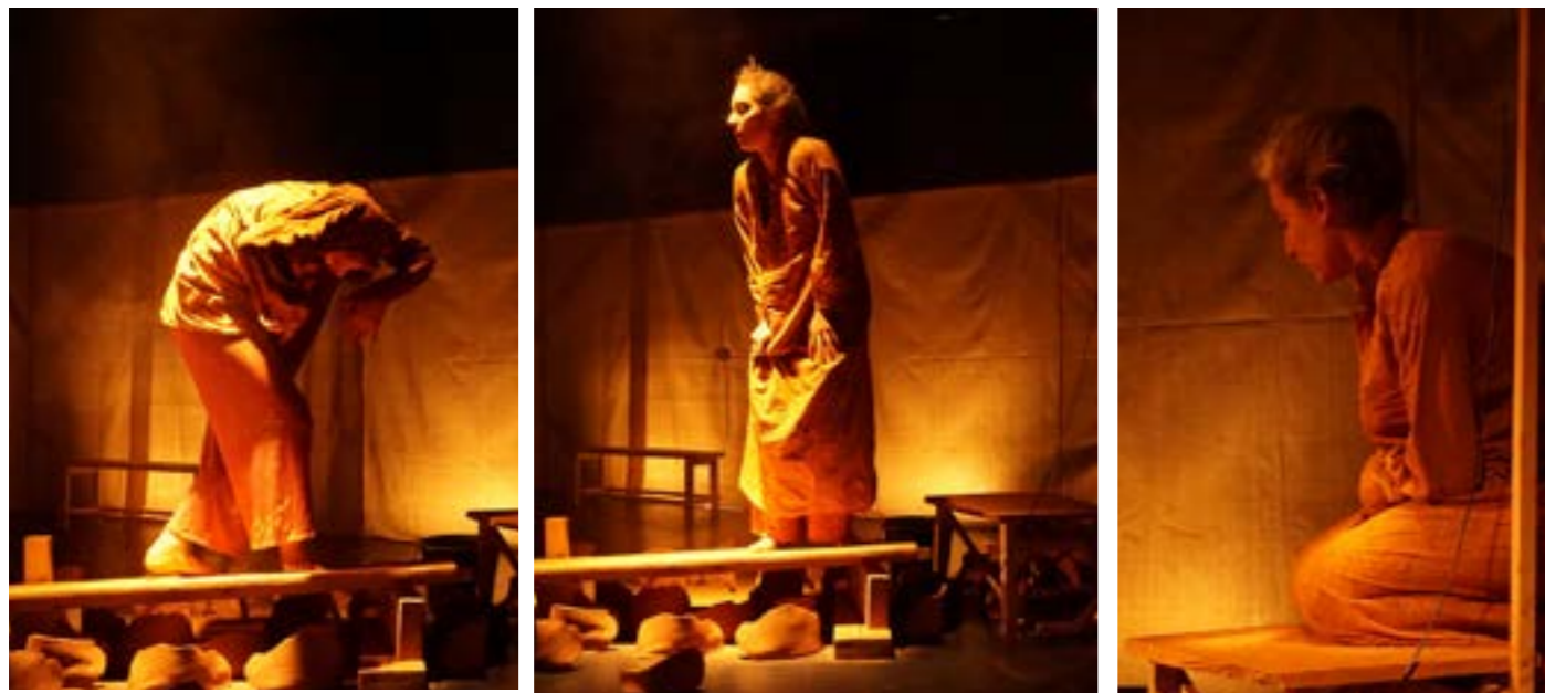
transformation symbolique en vieille femme - création sans public TJP Strasbourg - janvier 2021

Le spectacle étant destiné aux tout-petits, ces inspirations nourriront la recherche en sous couches, tout en restant traité de façon ludique et légère à la destination du public concerné.