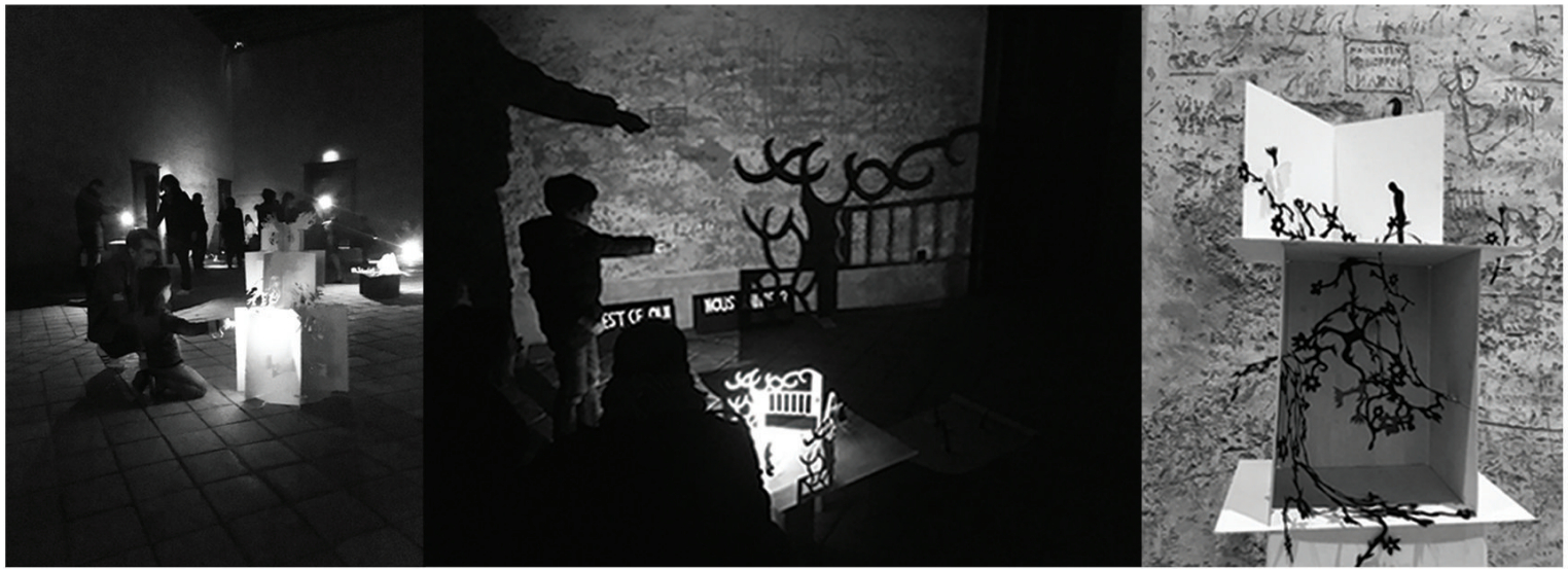
Une expérience immersive au pays des ombres